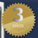
PURIFICADOR AERAMAX DX5

Garanteix 3 renovacions d'aire per hora en un espai de 12m 2