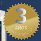
PURIFICADOR AERAMAX DX55

Garanteix 3 renovacions d'aire per hora en un espai de 28m 2