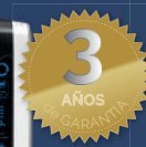
PURIFICADOR AERAMAX DX95

Garanteix 3 renovacions d'aire per hora en un espai de 42m 2